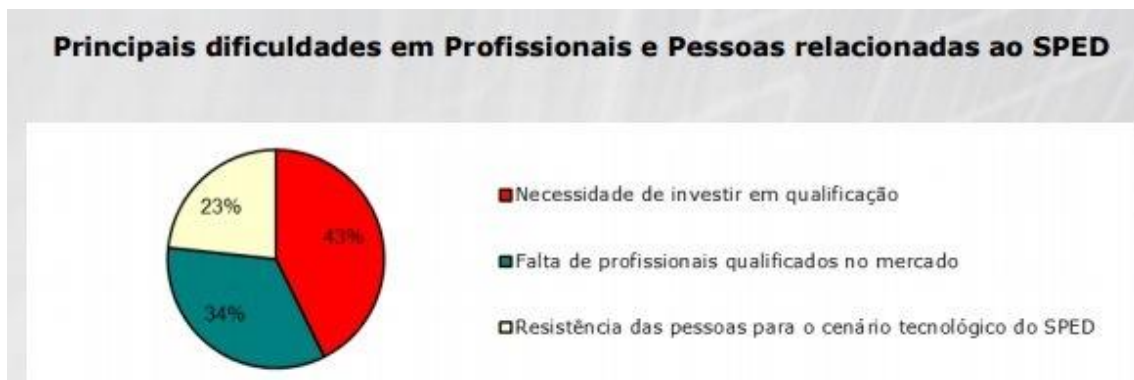
Gráfico 2: Principais dificuldades em profissionais e pessoas relacionadas ao SPED

Dentre as dificuldades elencadas pelos profissionais e pessoas quanto ao sped, o investimento em qualificação foi apontado como o mais importante ponto a ser explorado com 43%, demonstrando que o pessoal responsável por sua adequação e envio, ainda encontra-se momentaneamente despreparado ou sem segurança suficiente para tal.