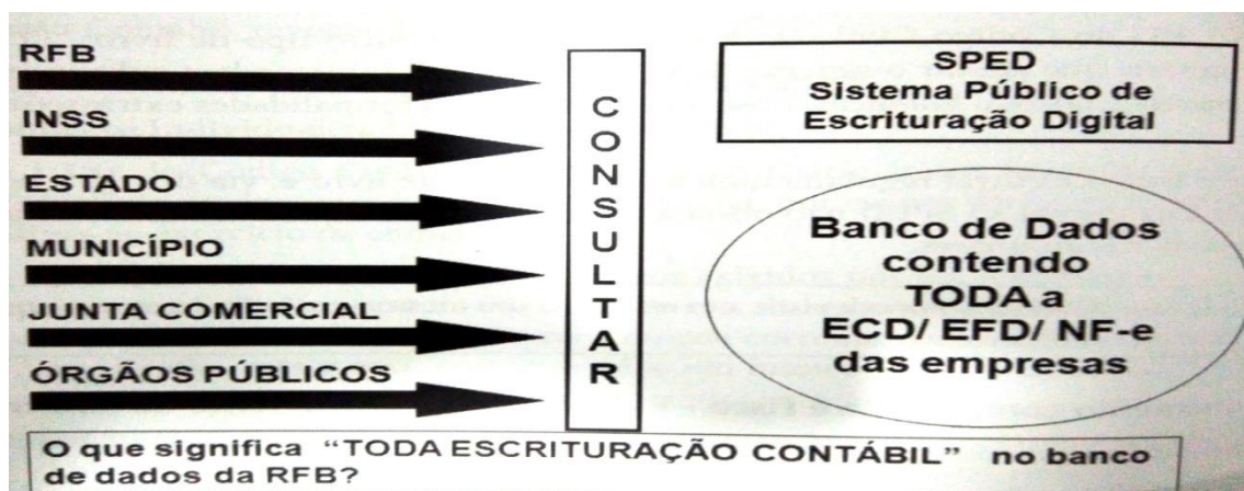
Figura 1: Usuários do banco de dados SPED.

Azevedo e Mariano (2014, p. 316) resume as entidades que usarão o banco de dados da RFB como fonte de informação: