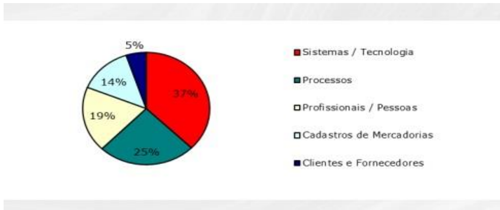
Gráfico 1: Dificuldades com o SPED

implementação do SPED. 37% dos entrevistados alegaram dificuldade no quesito sistemas/tecnologia, enquanto 25% nos processos.