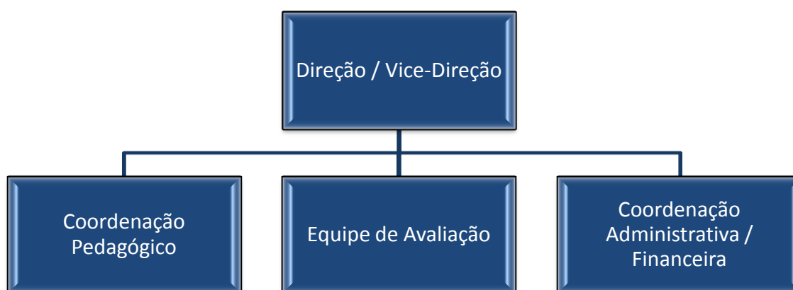
Gráfico 2 – Organograma do CEEI

A equipe gestora é composta por direção e vice-direção, além de uma coordenação financeira que é responsável pelos repasses de verbas governamentais, pela prestação de contas e aplicação dos recursos. A secretária da instituição é responsável pela documentação dos alunos, conforme gráfico 2.